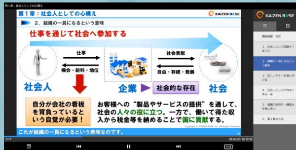
※eラーニング学習画面のイメージ

本講座では、社会人としての心構えと基本マナーについて確認し、キラリと光る社員になるために必要な考え方について学習を行います。