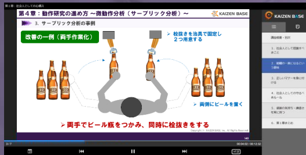
※eラーニング学習画面のイメージ

動作研究は、方法研究に属する手法の1つです。あらゆる仕事には、必ず一番良いのやり方があります。本講義では、ただ漫然と現場を眺めるのではなく、一番良いやり方を追求する姿勢＝モーション・マインドを持つために必要な知識について体系的に学んでいきます。