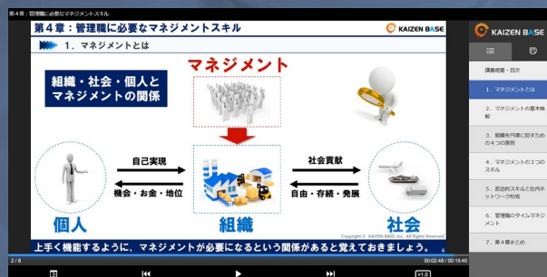
※eラーニング学習画面のイメージ

管理職は企業を支えていると言っても過言ではないほど大切な存在です。 管理職がいかにか自立的に考動できるかが企業存続の鍵となるのです。 本講座では、管理職の役割と心得について、マネジメントの基本と共に学習を進めていきます。