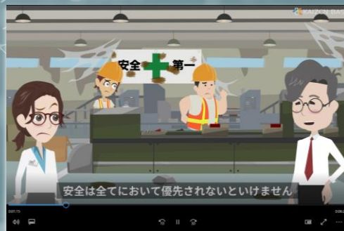
eラーニング学習画面 イメージ

ヒューマンエラーは、災害の要因として一番多く挙がるものです。本講座では、安全とはどういう状態のことか、ヒューマンエラーをどう考えたら良いのかを解説します。労働災害の具体例や、すぐに実践できる安全ルール11選など、各項目ごとに外せないチェックポイントを学びましょう。