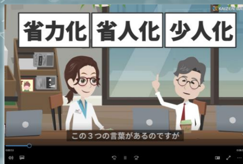
eラーニング学習画面 イメージ

入門編で学習した内容のおさらいから始まり、「7つのムダ」や、よく耳にする言葉の意味の違いについてなど、「トヨタ生産方式」の基本となる部分について総合的に学習します。入門編の内容から更に、より具体的な知識を深めていきましょう！