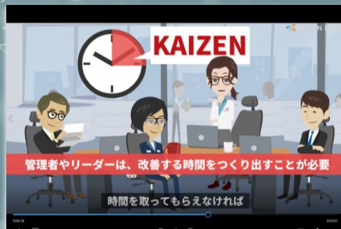
eラーニング学習画面 イメージ

日本から生まれたカイゼンは、海外でもそのまま「KAIZEN」と表現されるほどに、世界中で重要なキーワードになっています。世界で広がるカイゼン。本講座ではその狙いと考え方について学習を行います。